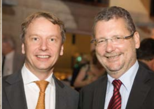
Günther H. Oettinger, Ministerpräsident des Landes Baden-Württemberg